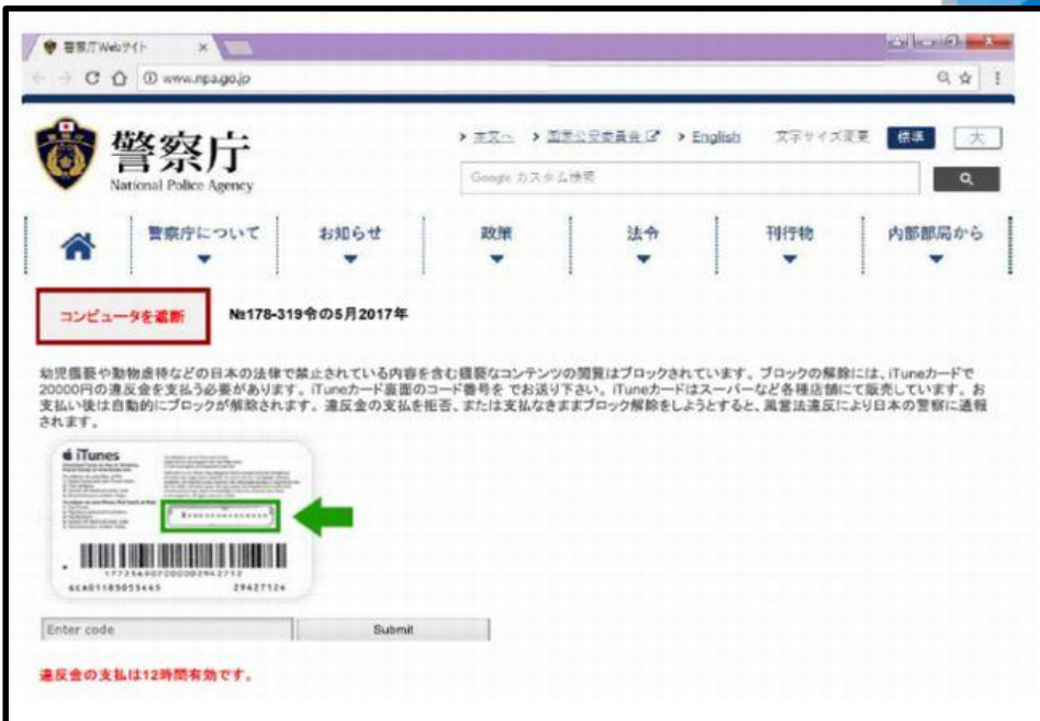
表示される偽サイトの画面

この偽サイトは、警察庁の公式サイトに酷似したサイト上に、「幼児猥褻や動物虐待などの日本の法律で禁止されている内容を含む猥褻なコンテンツの閲覧はブロックされています。ブロックの解除には、iTune カードで20000円の違反金を支払う必要があります。iTune カード裏面のコード番号を でお送り下さい。iTune カードはスーパーなど各種店頭にて販売しています。お支払い後は自動的にブロックが解除されます。違反金の支払を拒否、または支払なきままブロック解除をしようとする、風営法違反により日本の警察に通報されます。」(原文のとおり。)との警告文を記載するとともに、iTunes カードの裏面の画像を掲載するなどしています。