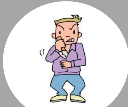
危険な器具の携帯