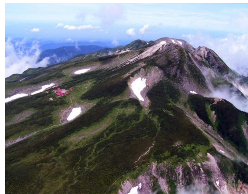
白山山頂及び室堂付近