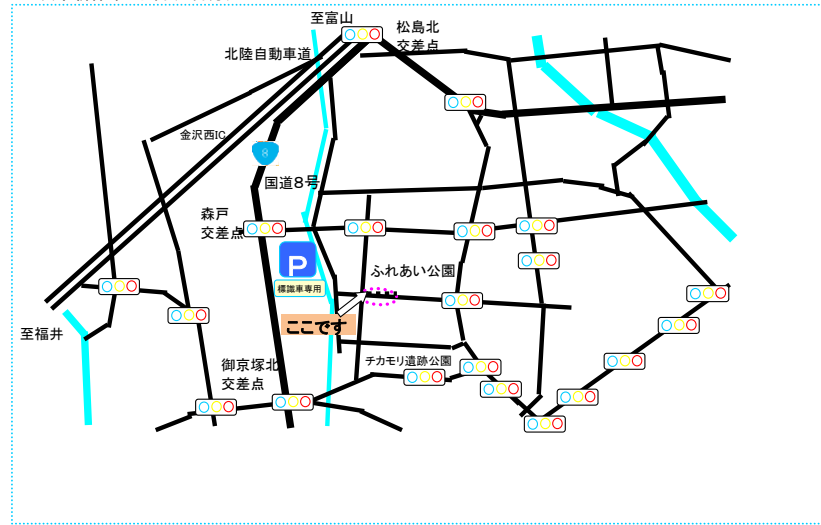
金沢市新保本4丁目(3台分)