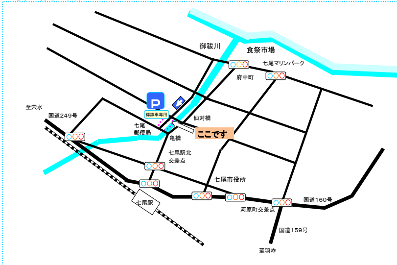
七尾市生駒町(3台分)