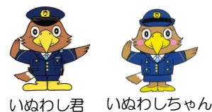
いぬわし君 いぬわしちゃん