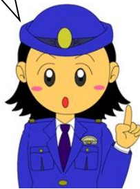
被害の状況（平成25年9月末現在）

石川県警察では、振り込め詐欺などの被害を防止する観点から金融機関に対し、お客様への声かけのほか、最寄りの警察署への連絡を求めています。皆様のご理解とご協力をお願いいたします。