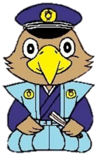
石川县警察 吉祥物 山鹰先生

石川县在日本国内属于治安良好的地区之一，但是，这并不意味着绝对没有犯罪事件发生。如果您在旅行途中遇到犯罪事件的话，就破坏了您愉快的旅行。为了防患未然，让您在旅途中留下美好的回忆，请您注意以下几点。