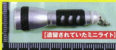
【遺留されていたミニライト】