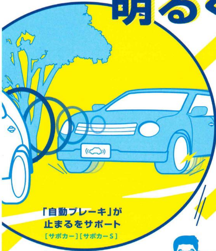
「自動ブレーキ」が 止まるをサポート [サポカー][サポカー-S]