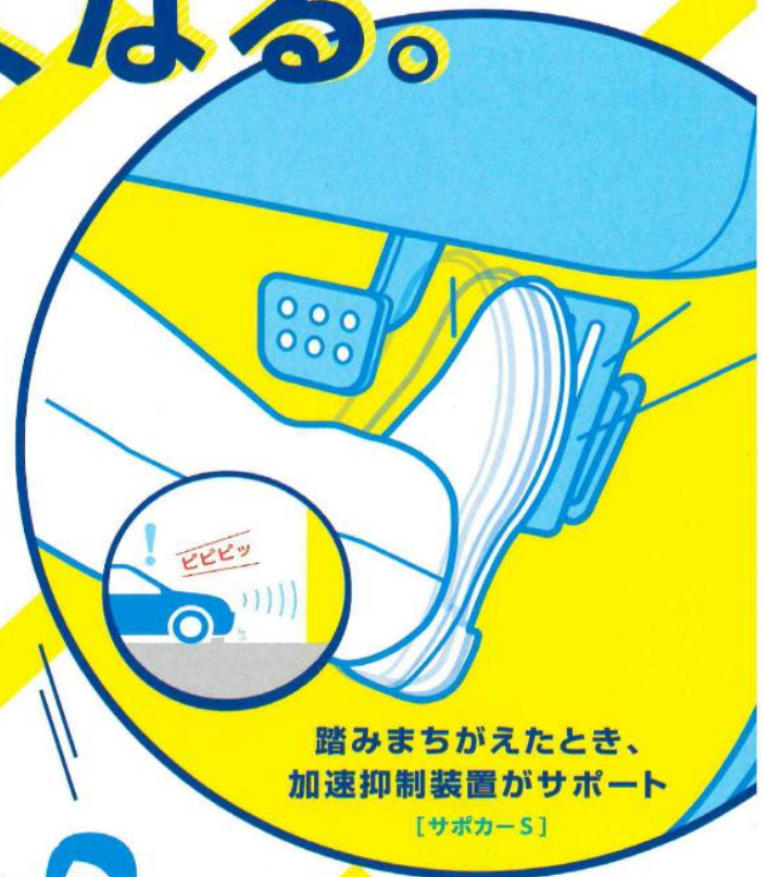
踏みまちがえたとき、 加速抑制装置がサポート [サポカー-S]